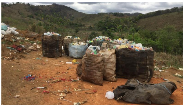
FIGURA 21 - Depósito de resíduos recicláveis na área aterro controlado.