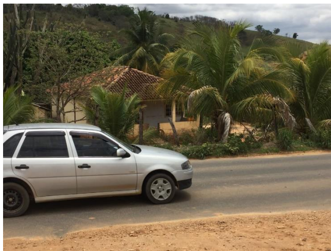
FIGURA 6 - Residência próxima a entrada do aterro controlado.