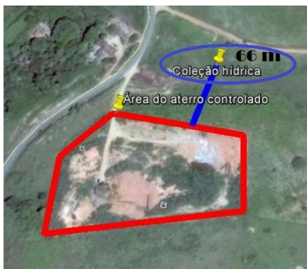
FIGURA 12 - Distância entre o aterro controlado e a coleção hídrica mais próxima.

O recurso hídrico mais próximo está localizado na coordenada geográfica 23k 798856 E, 7852911 S, equivalente a 66 metros do perímetro do aterro (FIG.12), trata-se de uma área de brejo com pequeno fluxo de água, que é canalizado por uma obra de drenagem. Tal situação encontra-se em desconformidade com a NBR 13.896/97 que estabelece uma distância mínima de 200 m.