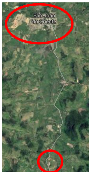
FIGURA 4 - Localização do Aterro Controlado.

A destinação final dos RSU's de São João do Oriente é realizada no aterro controlado da cidade (FIG. 4). Para realizar a caracterização da área, foram utilizados como parâmetros os critérios locacionais e estruturais das NBR's 8.419/1992, 13.896/1997 e 15.849/2010 listados no QUADRO 1. Para coleta de dados foi utilizado um GPS ( Global Positioning System ) da marca Garmin modelo eTrex Waterproof Hiking no qual, foram obtidas as coordenadas geográficas UTM ( Universal Transversa de Mercator ) dos pontos de interesse.