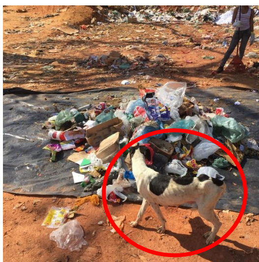
FIGURA 15 - Cachorro encontrado dentro do aterro.