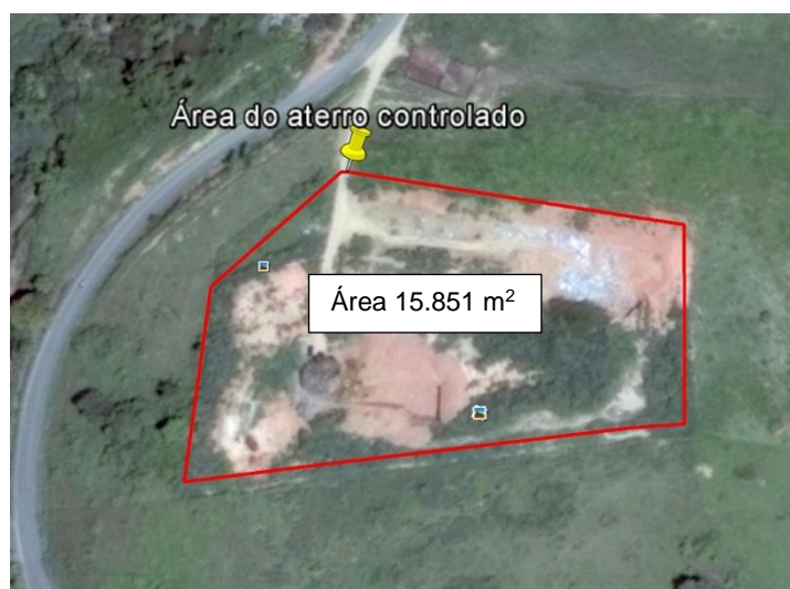
FIGURA 8 - Área total do aterro controlado.