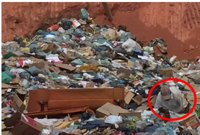
FIGURA 20 – Presença de catador no local.