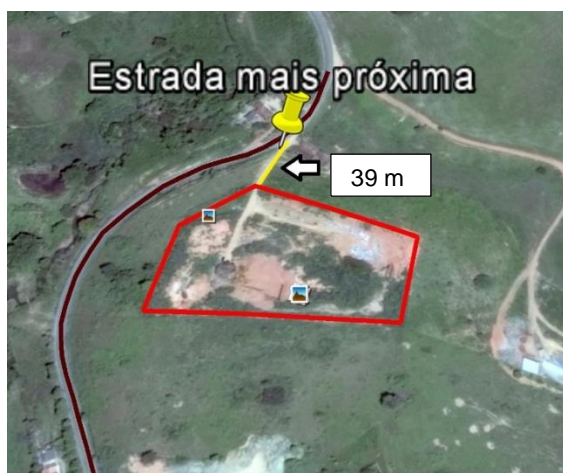
FIGURA 9 - Distância entre o aterro controlado e a estrada mais próxima.