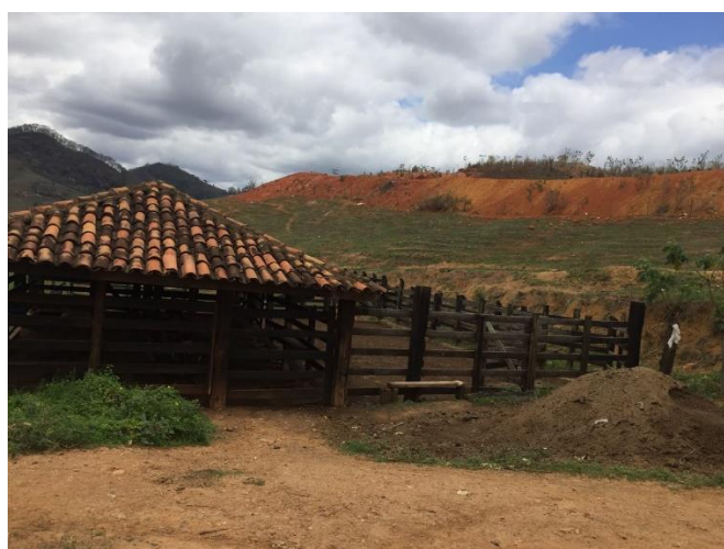
FIGURA 11- Curral situado na entrada do aterro.