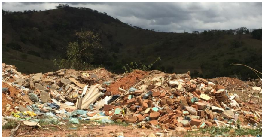
FIGURA 17 - Resíduos de construção civil dispostos no aterro.