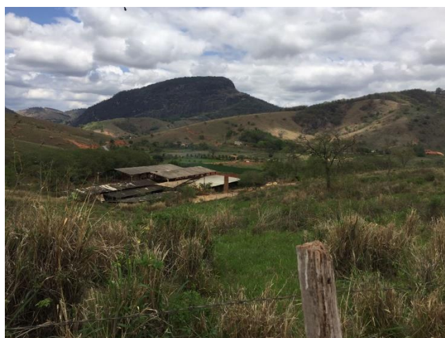
FIGURA 7 - Fábrica de cerâmica localizada nas proximidades do aterro.