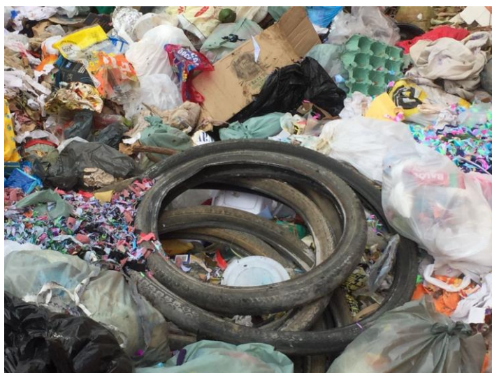
FIGURA 16 - Resíduos pneumáticos dispostos no aterro.

Foram encontrados na área das valas resíduos especiais como pneumáticos (FIG. 16), lâmpadas e pilhas/baterias. O local também é usado como “bota fora” de resíduos de construção civil (FIG. 17).