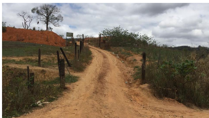
FIGURA 10 - Estrada de acesso ao aterro controlado.