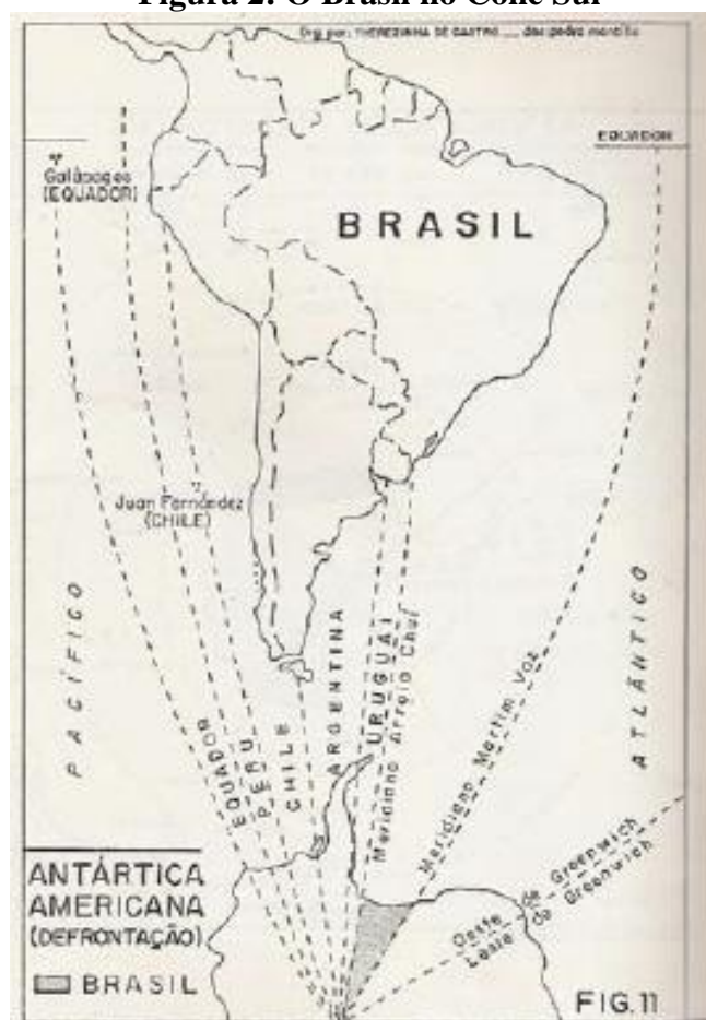
Figura 2: O Brasil no Cone Sul

Autores como Andrade (2001), Tosta (1984) e Castro (2010) observam em seus trabalhos como o papel de protagonismo regional da geopolítica brasileira possui especial atenção dos teóricos da geoestratégia, na esteira do desenvolvimento do bloco regional formado pelos países do Mercosul. Em um dos seus trabalhos, Castro (1976) aponta o poderio de força geopolítica do Brasil não apenas no Cone Sul, mas também no território antártico objeto de disputa de interesses econômicos e territoriais, conforme disposto na Figura 8.