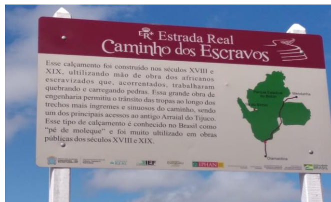
Figura 03: Caminho dos Escravos, Diamantina/MG.

Ademais, apesar do marco histórico dotado de riquezas e exploração o percurso que compõe o “Caminho dos Escravos” é esplêndido, com diversos visuais, cachoeiras, podendo citar o Poço Azul, e o Rio Jequitinhonha, em Mendanha. Para compor este cenário, também é possível citar a rica biodiversidade como a vegetação local caracterizada por frutas nativas como a mangaba, cagaita, o pequi; além de animais exóticos, tendo como exemplo a Onça Pintada, que infelizmente vem sendo ameaçada de extinção.