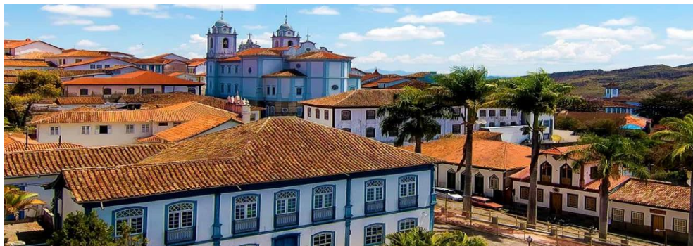
Figura 1: Centro de Diamantina/MG.

músicas e gastronomia, juntamente a exuberante paisagem natural proferem uma originalidade única à cidade.