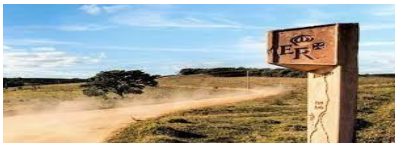
Figura 02: Símbolo da Estrada Real.

Uma vez que, a conservação do local possibilitará a longevidade da biodiversidade e perpetuação da história, fazendo com que os sujeitos se sintam subjetivamente pertencentes a este espaço.