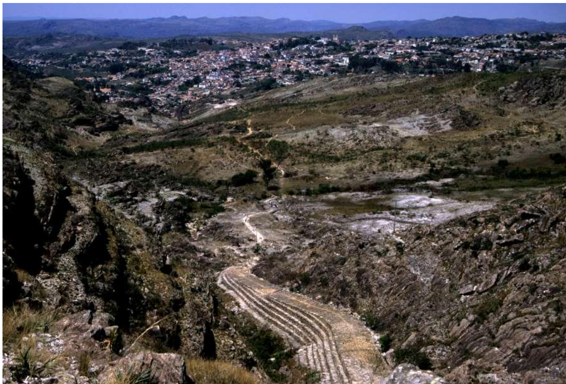
Figura 05: Trilha Caminho dos Escravos